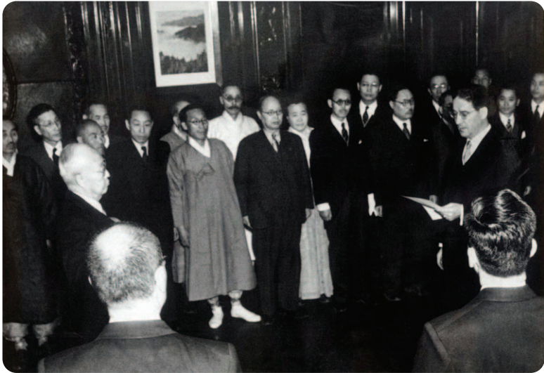
■ 신임장을 받는 무초 초대 주한 미국대사(1949.4.20)