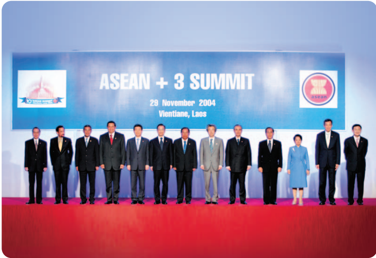
■ 2004년 ASEAN+3 정상회의(2004.11.29)