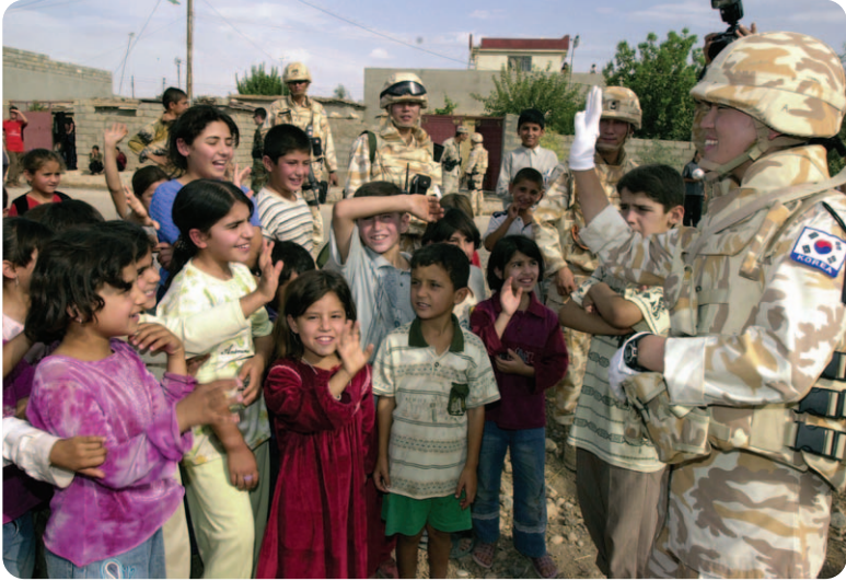
■ 이라크 파병 한국군의 PKO 활동(2004.10.8)