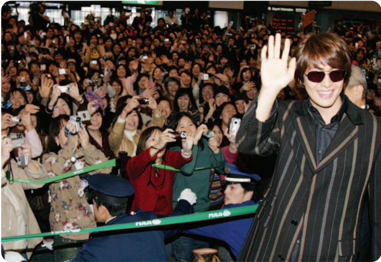
■ 세계 속 한국 대중문화(2004.11.25)