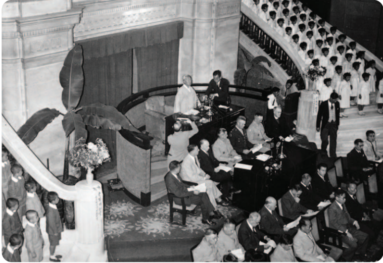
■ 제헌국회 개원식에 참석한 유엔 한국임시위원단과 미군정 수뇌들(1948.5.31)