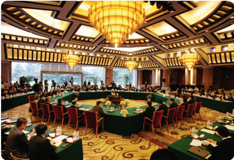
■ 제6차 6자회담 2단계 회의 개막(2007.9.27)