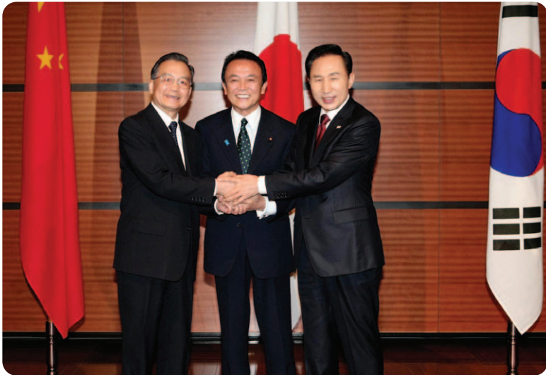
■ 제1차 별도 한·중·일 정상회의(2008.12.13)