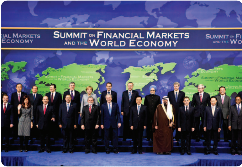
■ 제1차 G20 정상회의(2008.11.15)