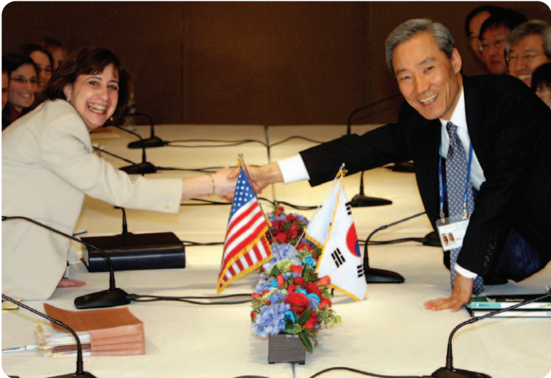
■ 한·미 FTA 교섭(2007.4.2)