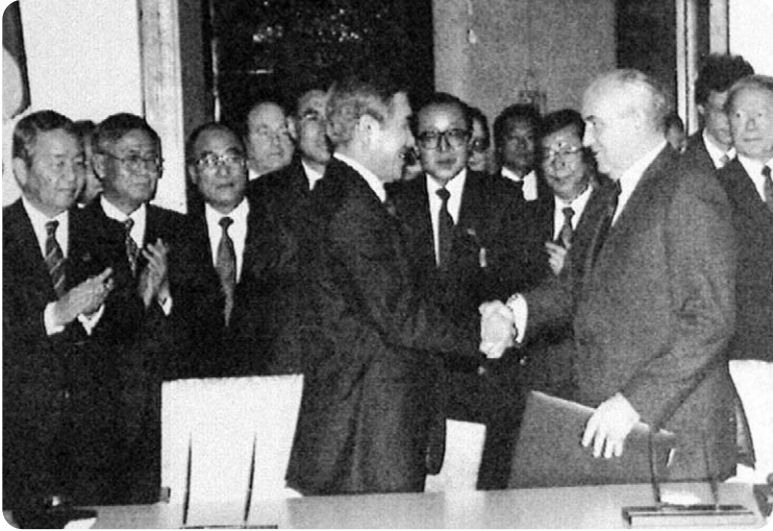
■ 한·소협정 조인식을 체결하는 노태우 대통령과 고르바초프 대통령(1990.12.14)