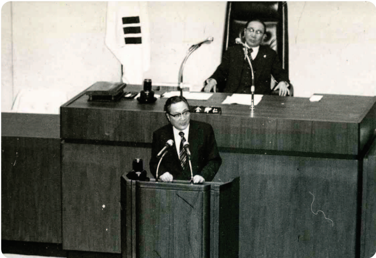
■ 유엔 및 비동맹회의의 참석결과를 보고하는 김동조 외무장관(1975.11.26)