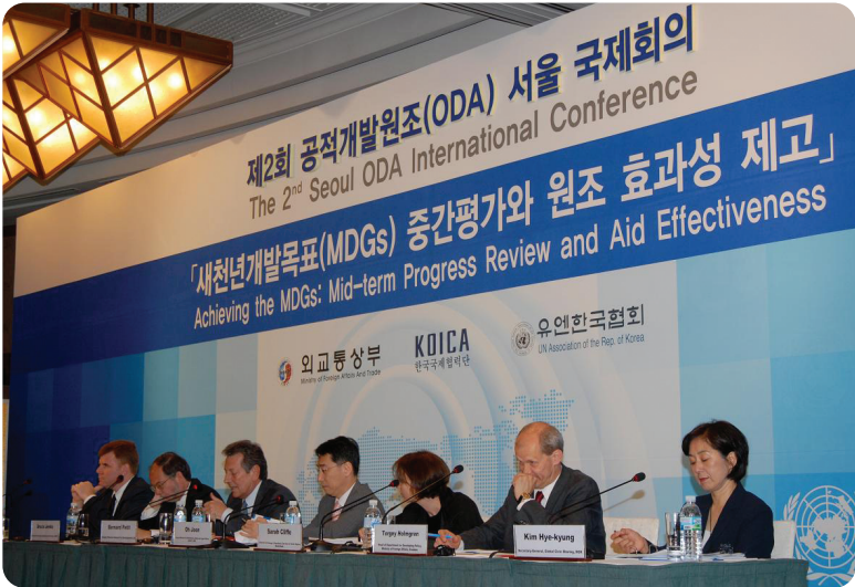
■ 2008년 제2회 ODA 서울 국제컨퍼런스(2008.6.3)