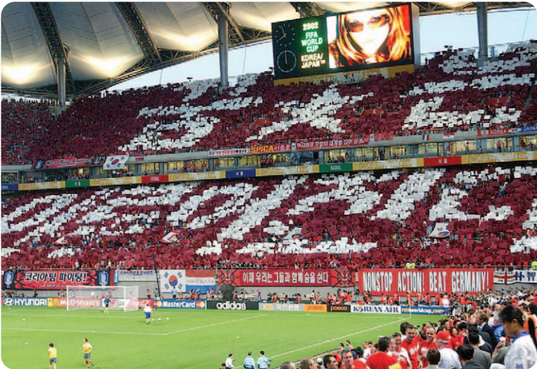
■ 2002년 한·일 월드컵 공동개최(2002.6.22)