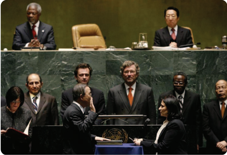
■ 반기문 제8대 유엔 사무총장의 취임선서(2006.12.14)