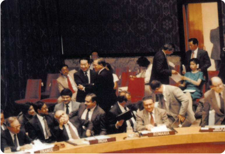
■ 1991년 남북한 유엔 동시가입(1991.9.18)