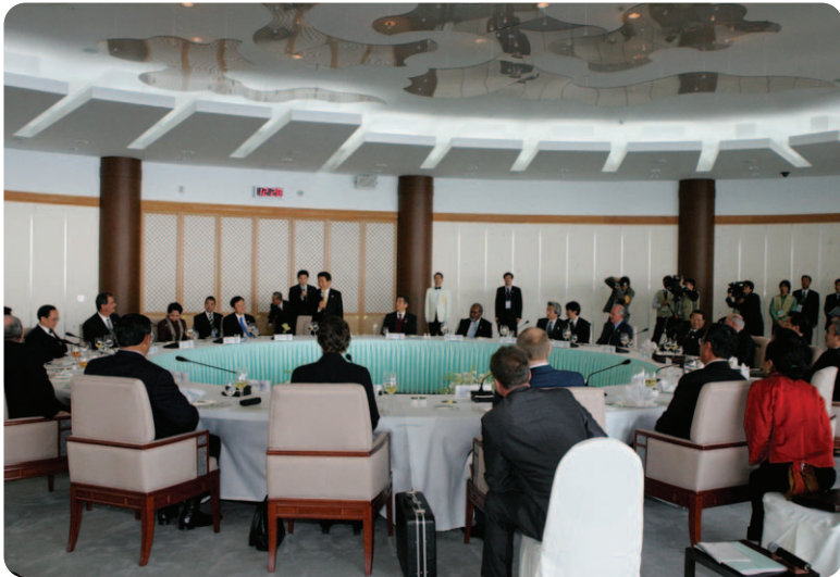
■ 2005년 부산 APEC 정상회의(2005.11.19)