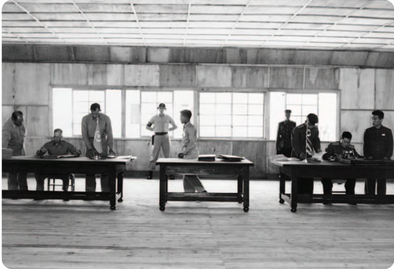
■ 정전협정 서명(1953.7.27)