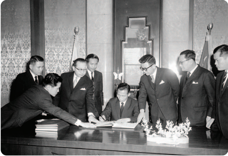
■ 한·일관계 정상화 관련 조약 비준서에 서명하는 박정희 대통령(1965.12.17)