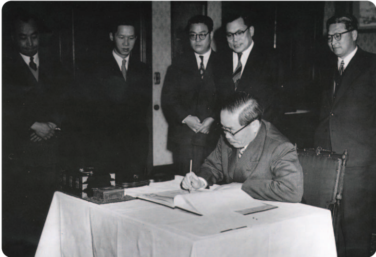
■ 한·미 상호방위조약 비준서에 서명하는 변영태 외무장관(1953.7.27)