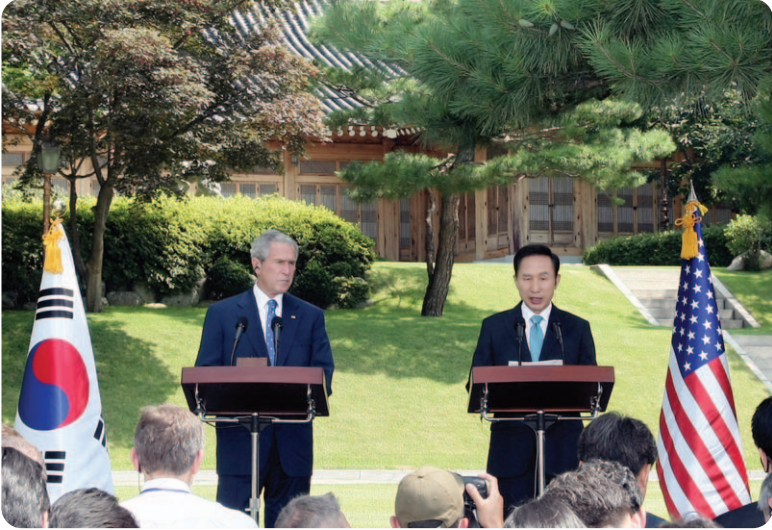
■ 한·미 정상 공동기자회견(2008.8.6)