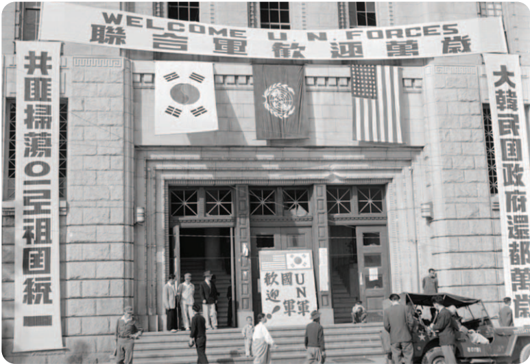
■ 서울 수복 후 시청에 걸린 유엔군 환영 현수막(1950)