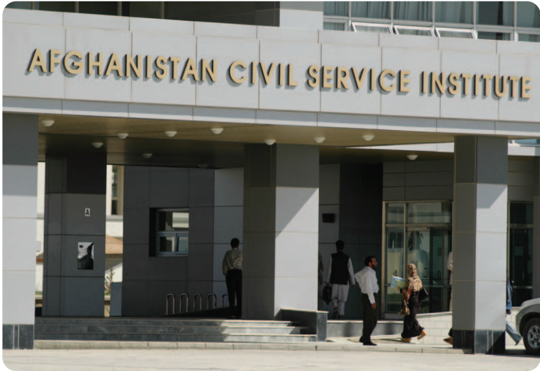
■ 아프가니스탄 공무원 연수센터 전경(2007.6.25)