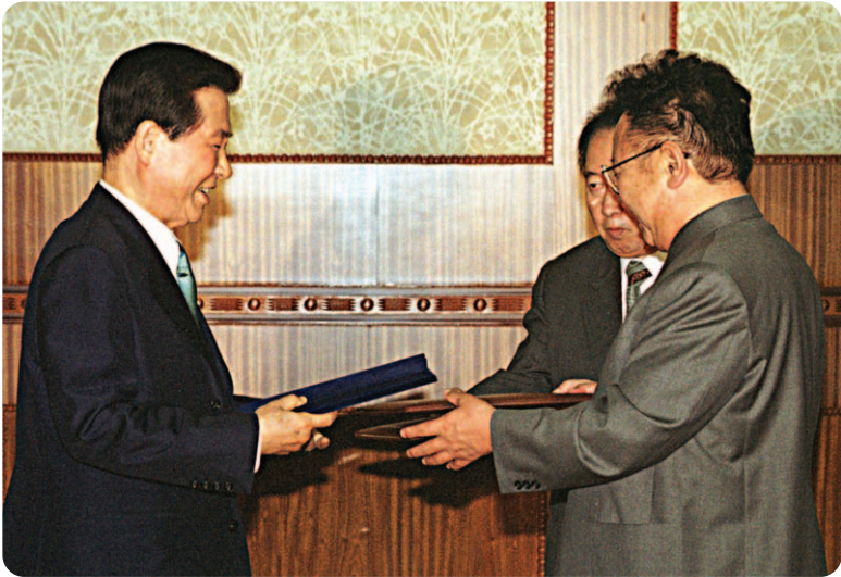
■ 2000년 남북정상회담(2000.6.14)