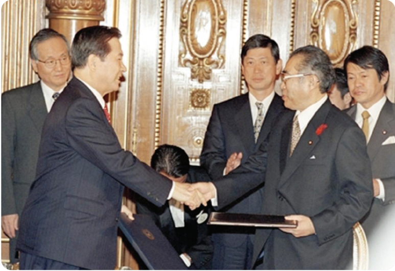
■ 1998년 한·일 파트너십 공동선언(1998.10.8)