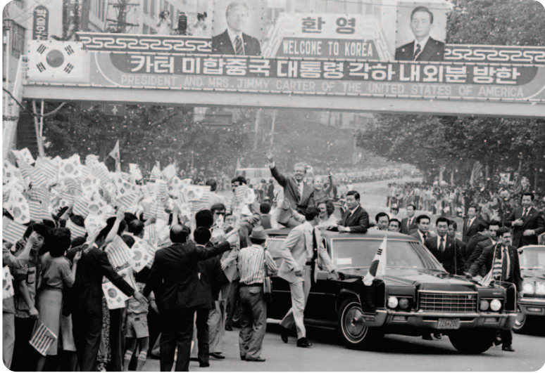
■ 카터 미국 대통령 방한 환영대회(1979.6.30)