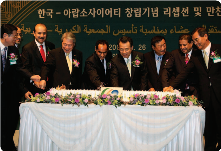
■ 한·아랍소사이어티 출범(2008.8.26)