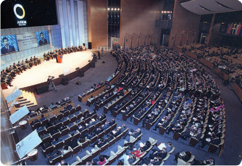
■ 2000년 서울 ASEM 정상회의(2000.10.20)