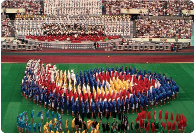
■ 제24회 서울 올림픽개임(1988.9.17)