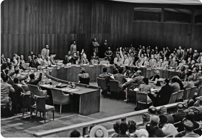
■ 한국전쟁 발발 직후 유엔군 참전을 결의하는 유엔 안전보장이사회(1950.6.26)